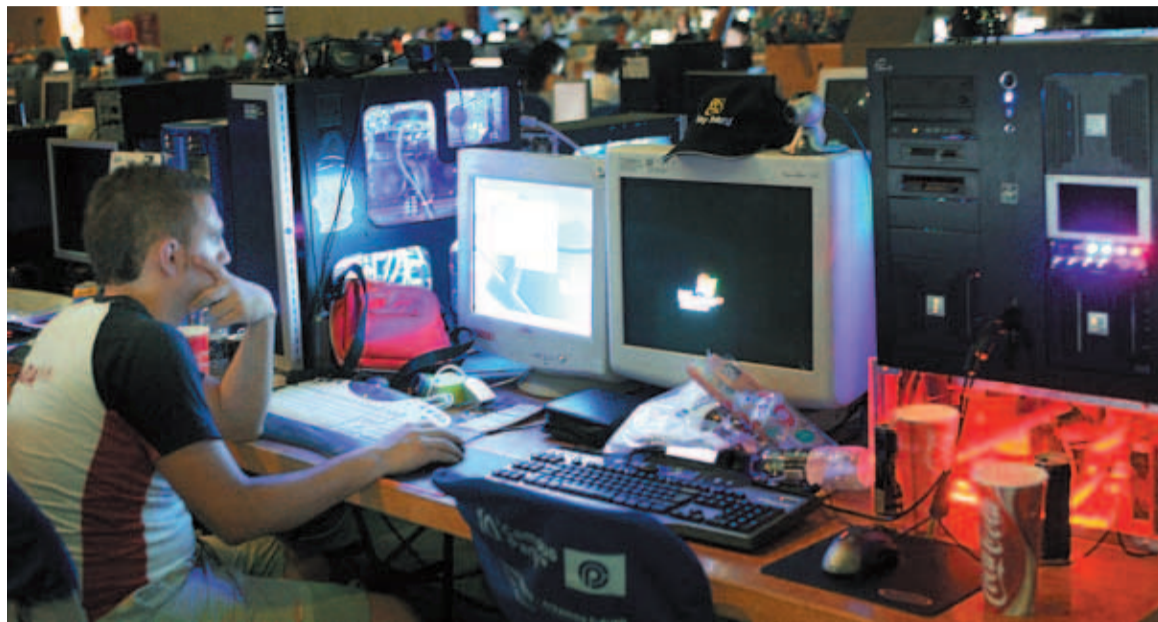
En España hay muchos amantes de la informática, como este asistente a la Campus Party, pero no todos son profesionales

Ingenieros y titulados conviven con simples aficionados en el sector de la informática, muy dañado por el intrusismo laboral . Las empresas no pueden vivir sin ellos pero la mayoría tiene sueldo de mileurista